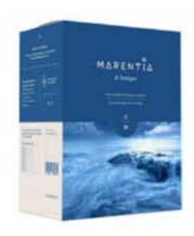
IAC215 51 Acqua di Mare alimentare