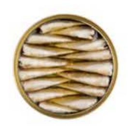
PECO36 120 ml 14 - 18 pz. per latta Sardina "Sardinilla" in olio d'oliva Real Conservera Española